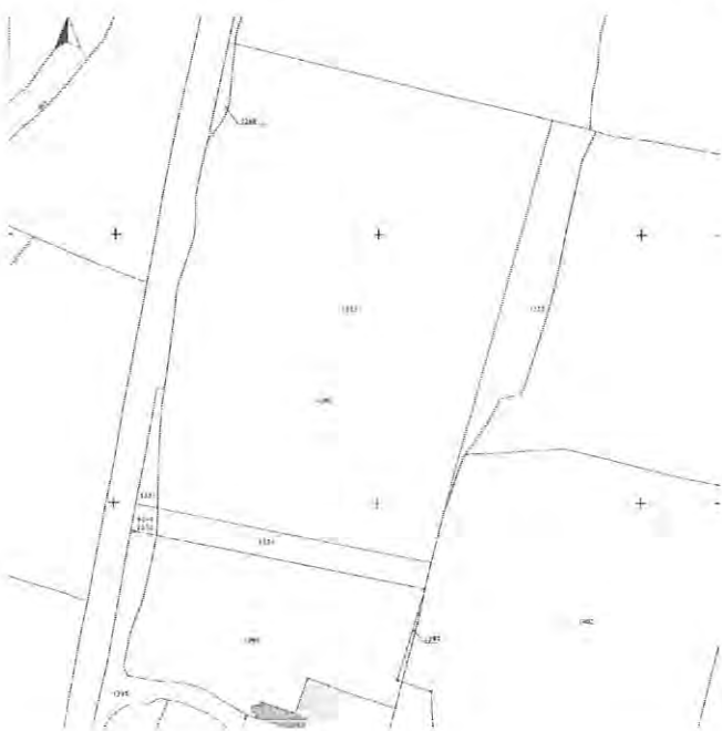
La ville aux Abbés (futur cimetière)

Ainsi, il est proposé d'établir une convention pour la période allant du 1 er janvier au 31 août 2022, et d'appliquer un loyer de 200 € pour l'ensemble de la période.